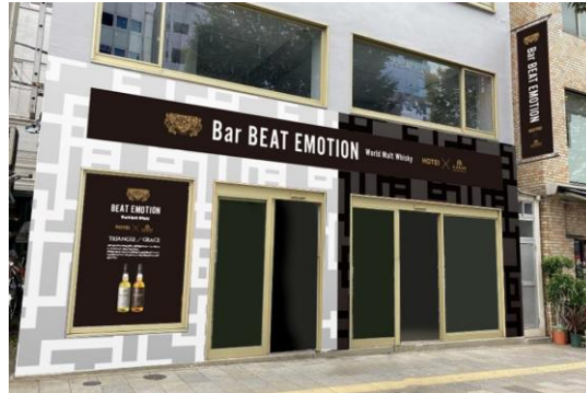
【特設バー 外装イメージ】

ギタリスト布袋寅泰の人生を象徴したウイスキー 「BEAT EMOTION」の発売を記念した、期間限定バー 「Bar BEAT EMOTION」が2023年4月26日(水)から表参道に登場！